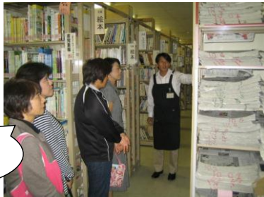
バックヤード 見学