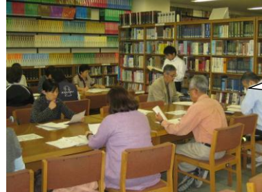
資料の調べ方 教室