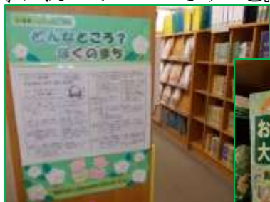
郷土資料コーナーの目印です！