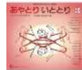
「あやとり いととり」 さいとう たま 著 つじむらますろう 画 福音館書店 <798>