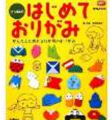
「はじめて おりがみ」 学研教育出版 <754>