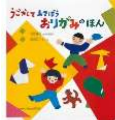
「うごかしてあそぼう おりがみのほん」 織茂 恭子 著 福音館書店 <754>