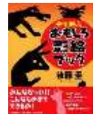
「手で遊ぶおもしろ 影絵ブック」 後藤 圭 著 PHP 研究所 <798>