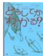
「世界のなぞかけ 昔話」 ジョージ・シャノン 著 ピーター・シス 画 福本 友美子 訳 偕成社 <798>