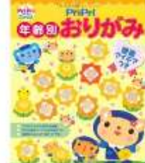
「プリプリ年齢別 おりがみ」 世界文化社 <754>