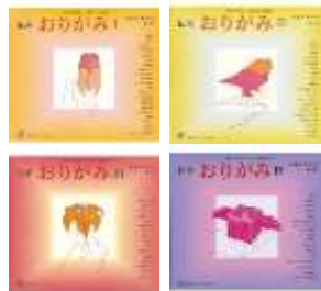
「おりがみ」 つじむらますろう 編・絵 福音館書店 <754>

1枚の紙から、いろいろなもの が作れます。子ども達には 魔法を使っているかのよう に見えるかもしれませんね。 動かせるものは、子ども達に とても喜ばれます。折る数 が少ないものは、小さい子 ども達も一緒に折って楽しむ ことができます。