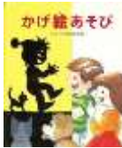
「かけ絵あそび」 中村 まさあき 著 岩崎 書店 <798>

光があつて影ができる ところなら、どこでも あそべます。手の指を曲 げたり、くっつけたりす ると、きつねになったり、 はとになったり。簡単な ものから、ちょっと手の 込んだものもあります。 何ができるかな？