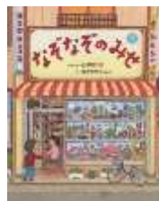
「なぞなぞのみせ」 石津 ちひろ 著 なかざわ くみこ 画 偕成社 <798>