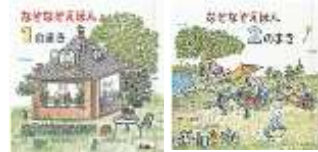
「なぞなぞえほん」 中川 季枝子 作 山崎 百合子 画 福音館書店 <754>

子ども達と一緒に頭の体操 はいかがですか？昔ながら のなぞなぞや、小さな子とも 達だけでなく、中学生の子 ども達にも楽しめる「謎か け」などもあります。家族み んなで「謎かけ」、「謎解き」 が楽しめます。