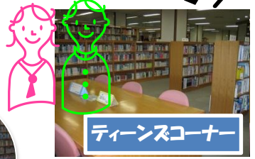
ティーンズコーナー

藤沢分館は、平成13年に開館した入間市内で四館目の図書館です。 「埼玉県福祉のまちづくり条例」に適合した、藤沢公民館と藤沢支所との複合施設です。 中高生の利用も念頭に入れた「ティーンズコーナー」があるのも、藤沢分館の特色です。 館内は、ゆったりとした空間がところどころにあります。 散歩の途中で立ち寄る人、調べ物や学習をする人、お子さまと絵本を見る人、家族や友達と本を借りにくる人、おはなし会を聞きにくる人... 様々な人がそれぞれの楽しみ方で利用しています。 ぜひ、一度お立ち寄りください！